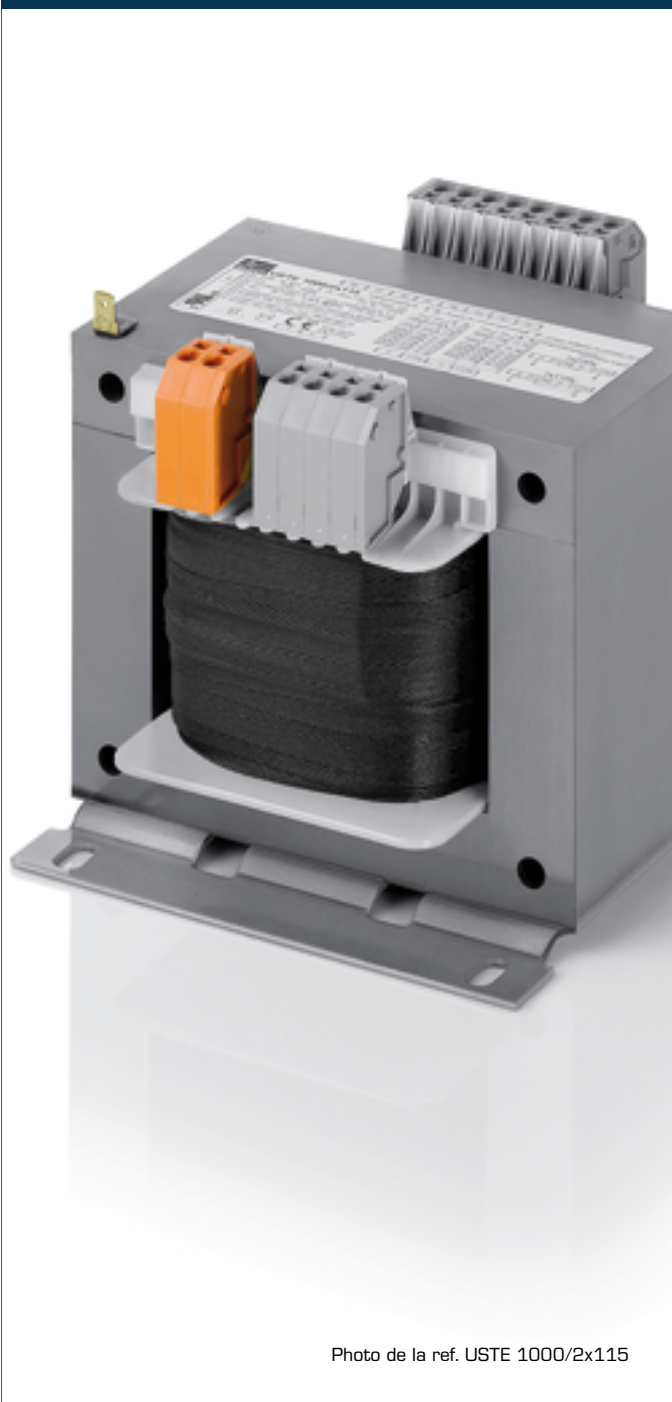
Photo de la ref. USTE 1000/2x115