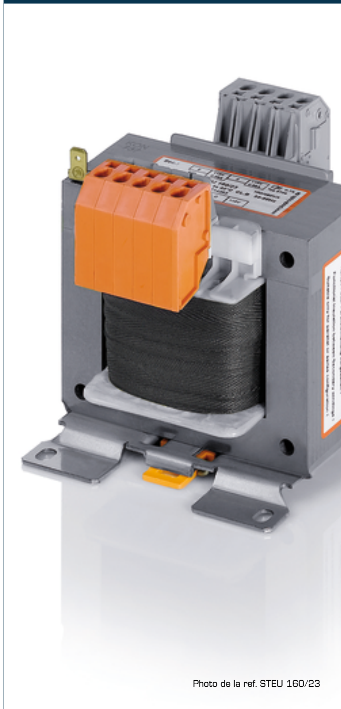
Photo de la ref. STEU 160/23