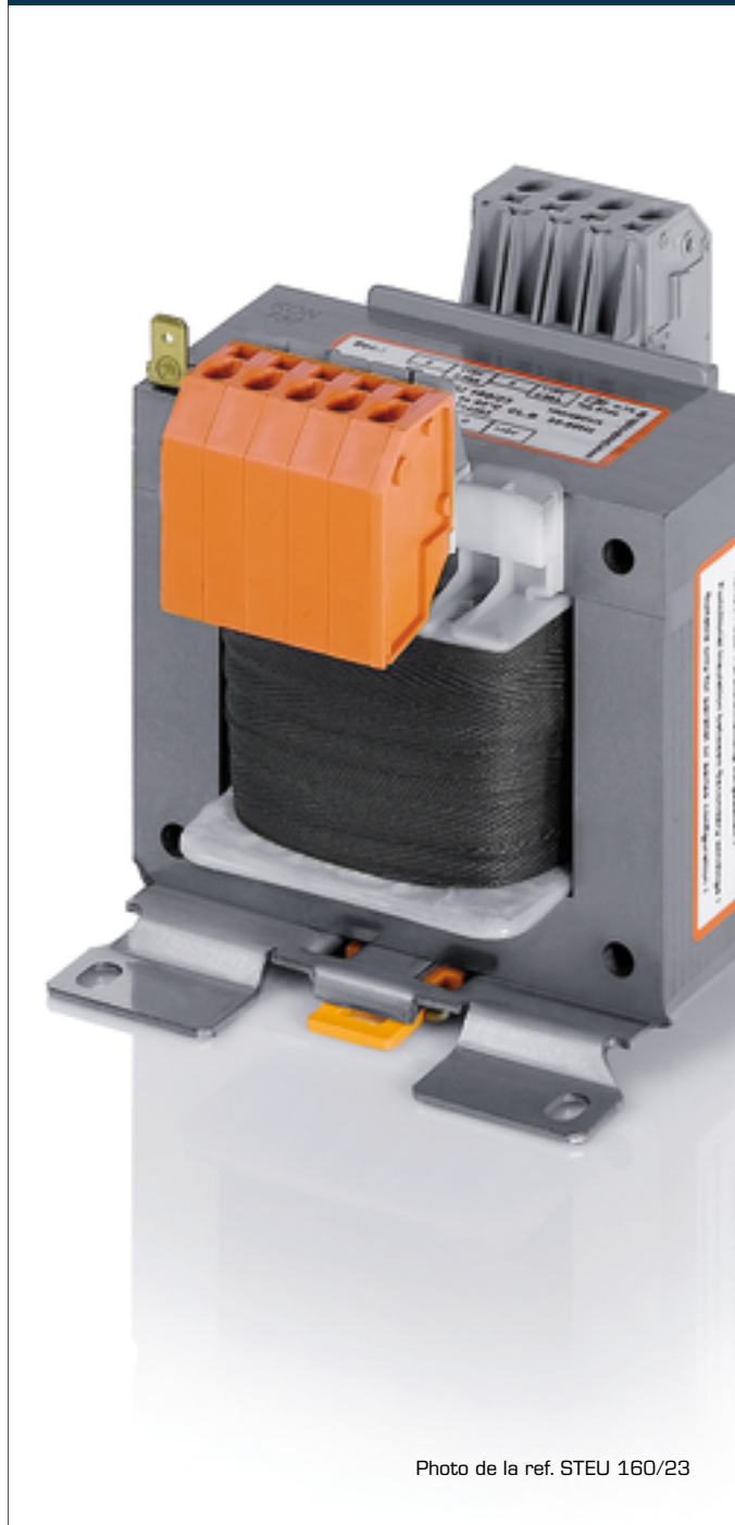
Photo de la ref. STEU 160/23