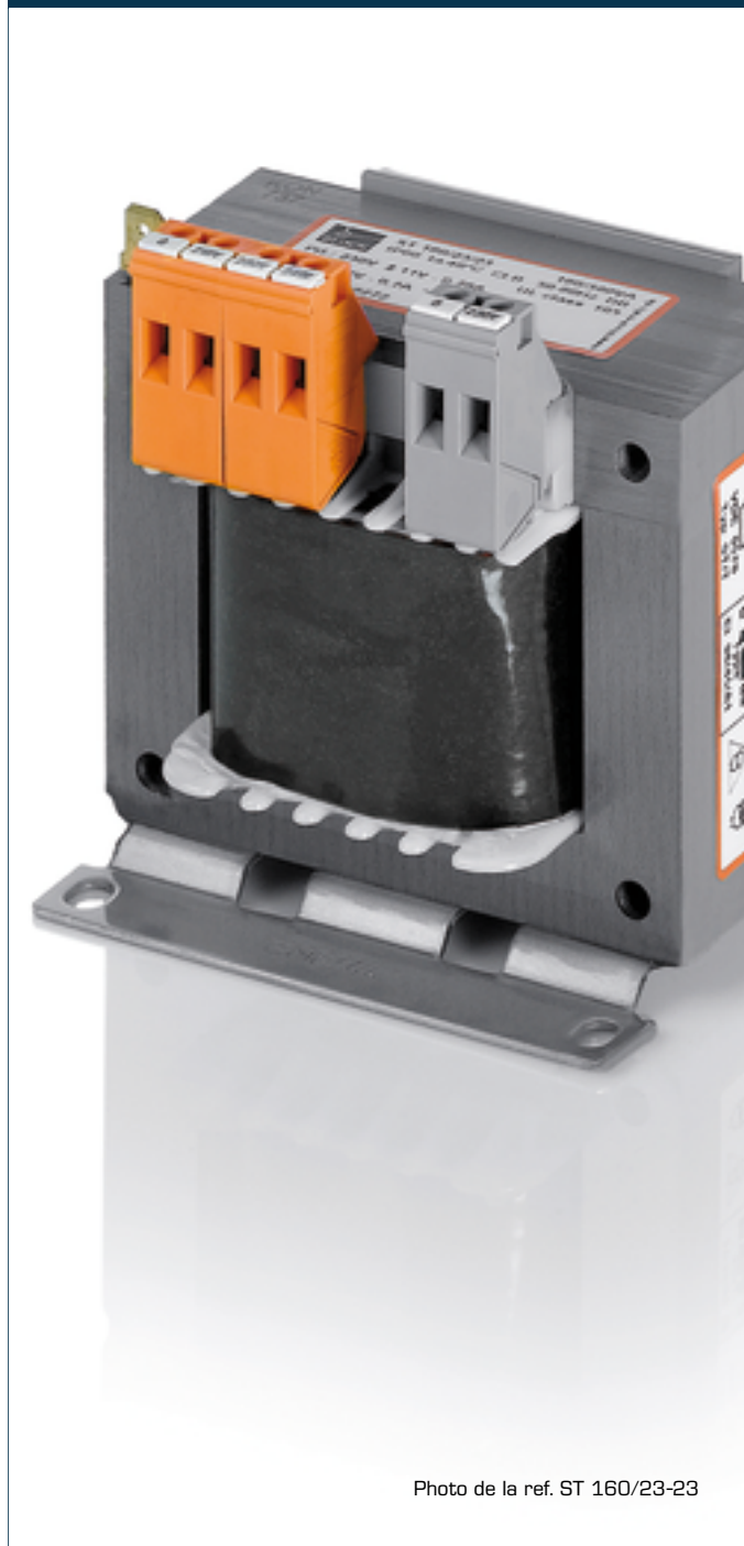
Photo de la ref. ST 160/23-23