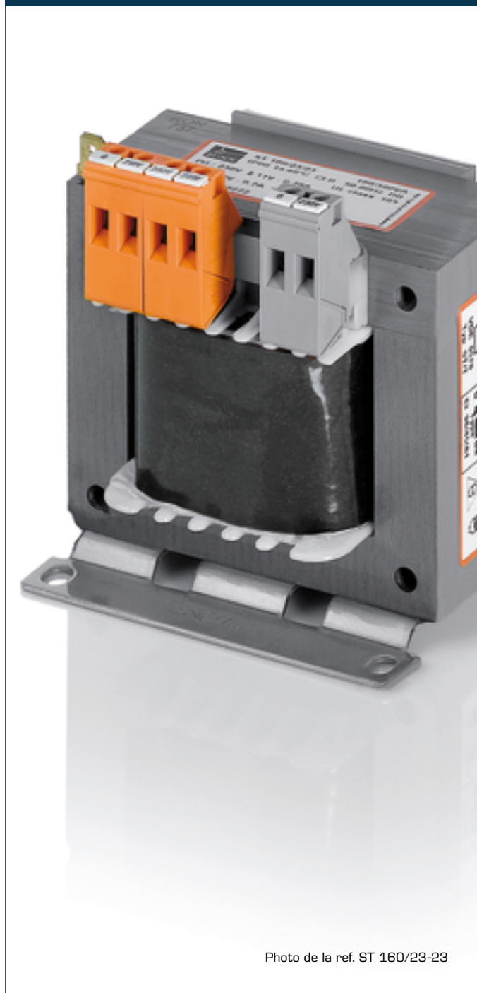
Photo de la ref. ST 160/23-23