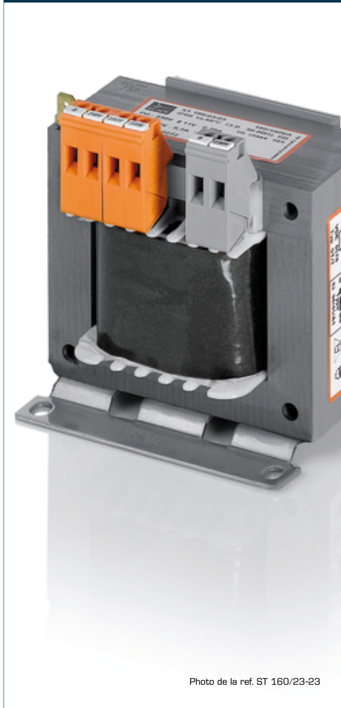
Photo de la ref. ST 160/23-23