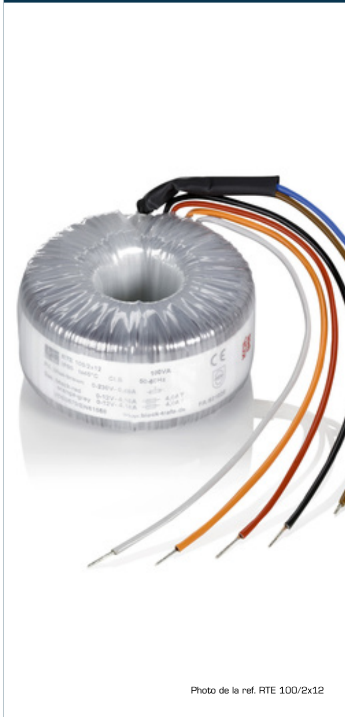
Photo de la ref. RTE 100/2x12