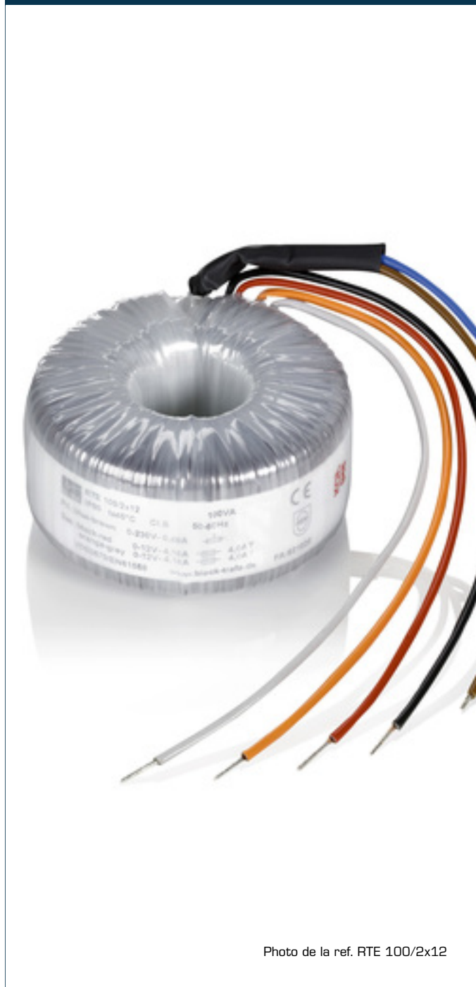
Photo de la ref. RTE 100/2x12