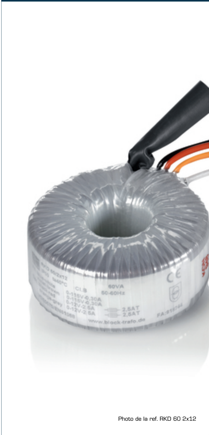
Photo de la ref. RKD 60 2x12