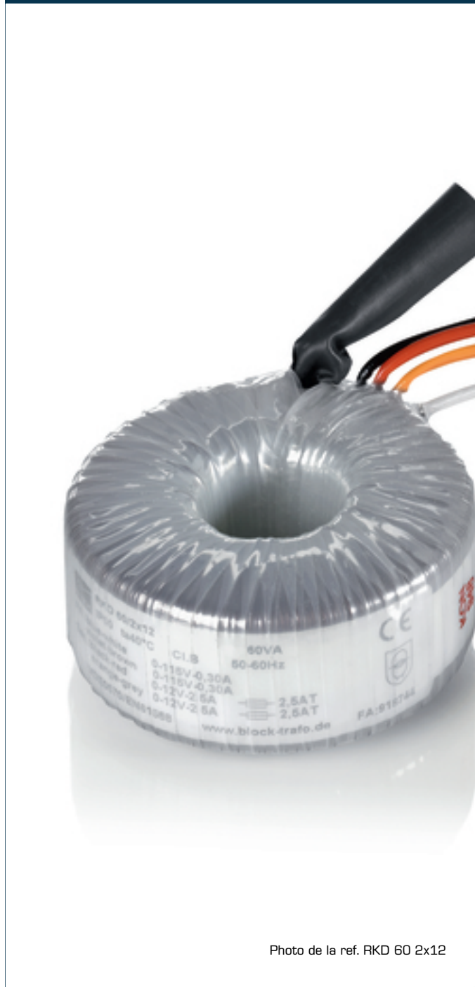
Photo de la ref. RKD 60 2x12