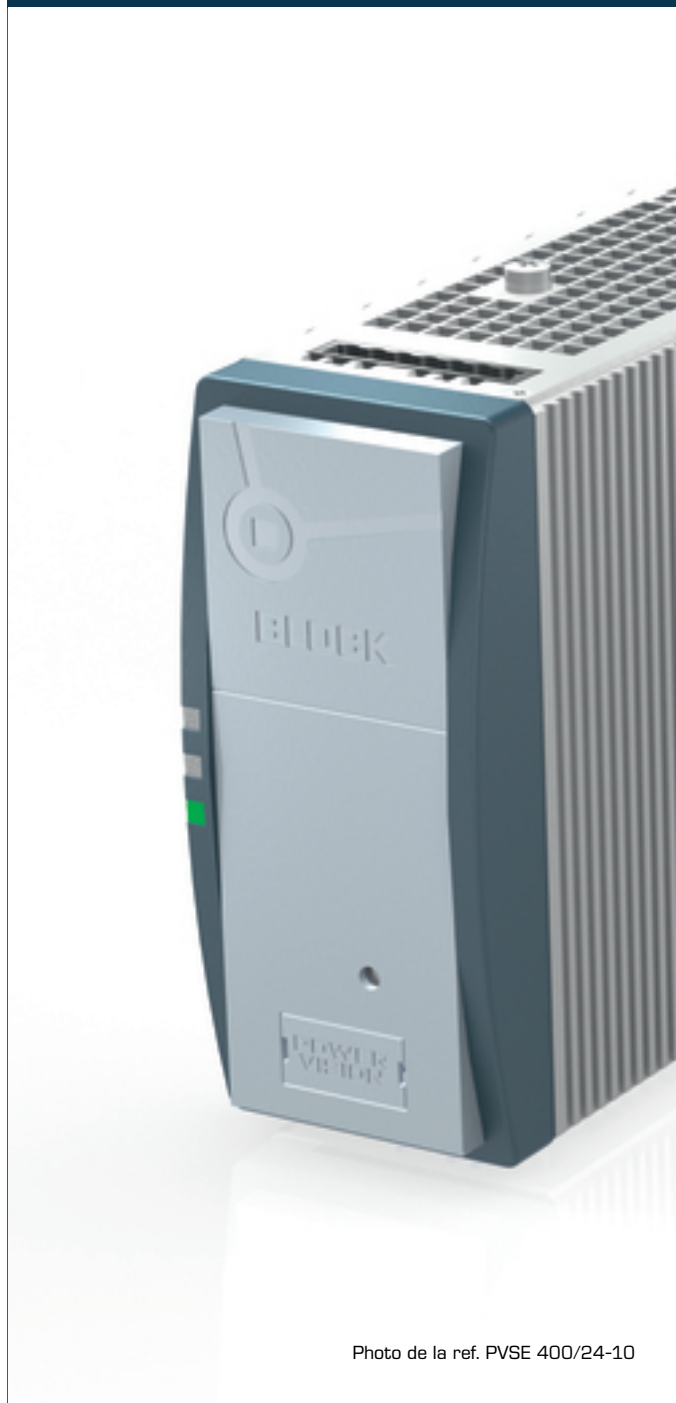
Photo de la ref. PVSE 400/24-10