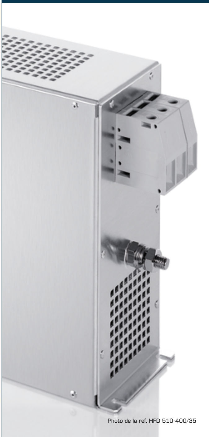
Photo de la ref. HFD 510-400/35