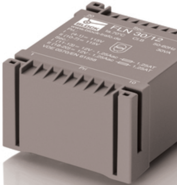
Photo de la ref. FLN 30/12