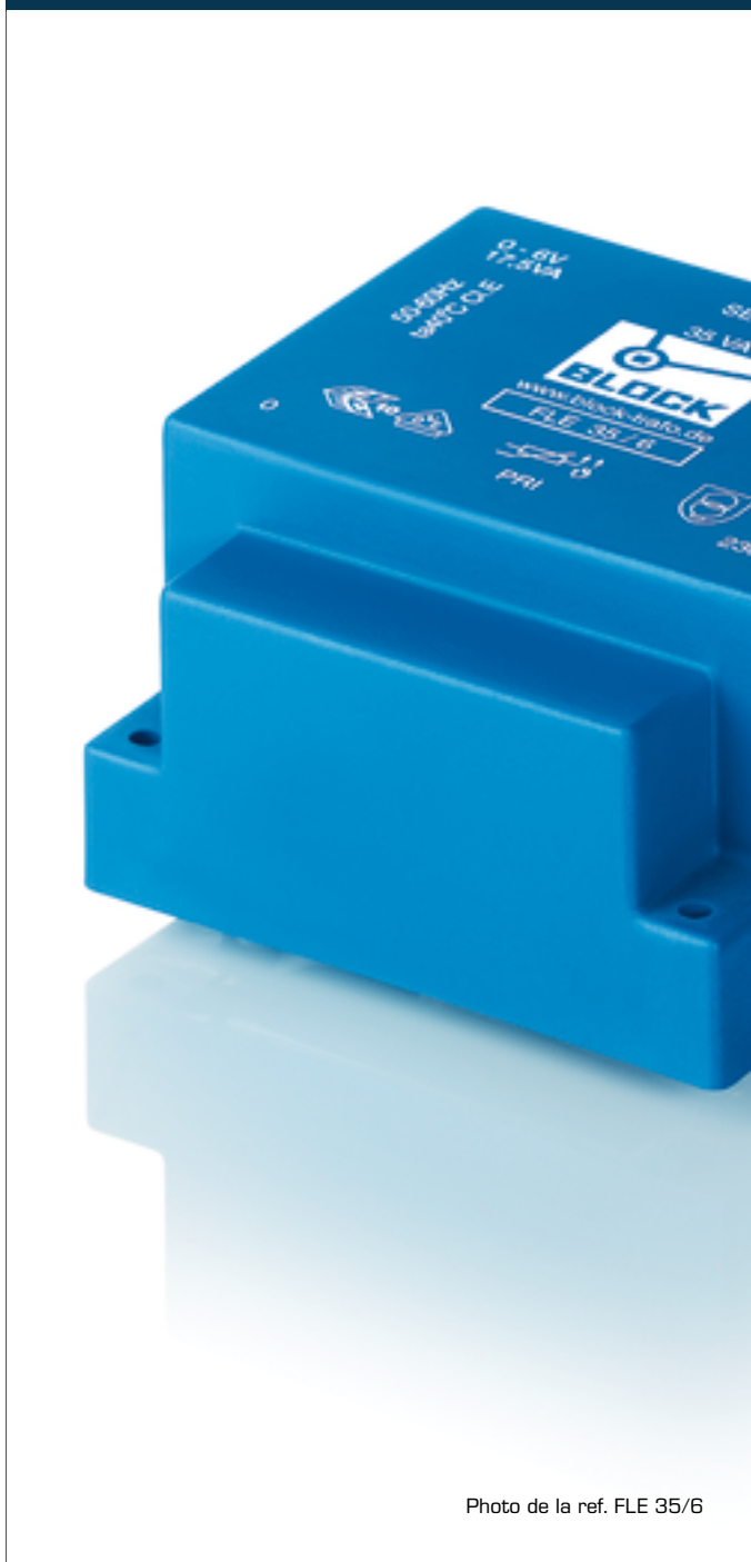
Photo de la ref. FLE 35/6