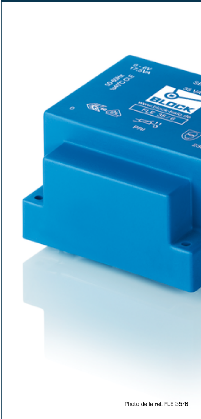
Photo de la ref. FLE 35/6