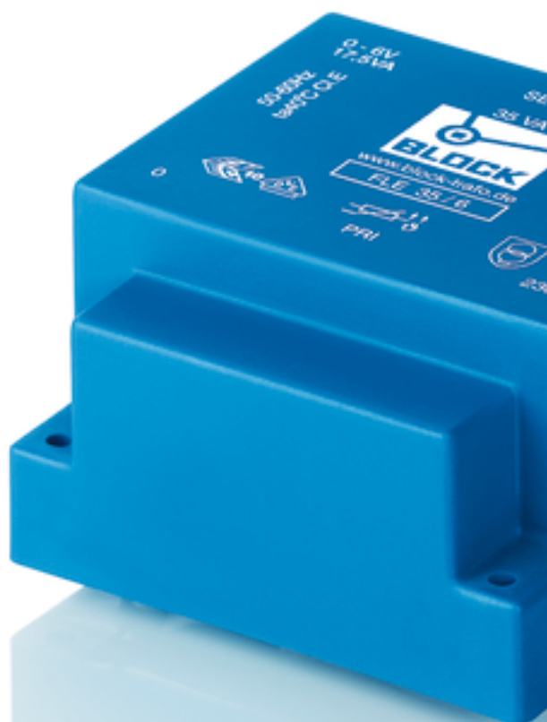
Photo de la ref. FLE 35/6