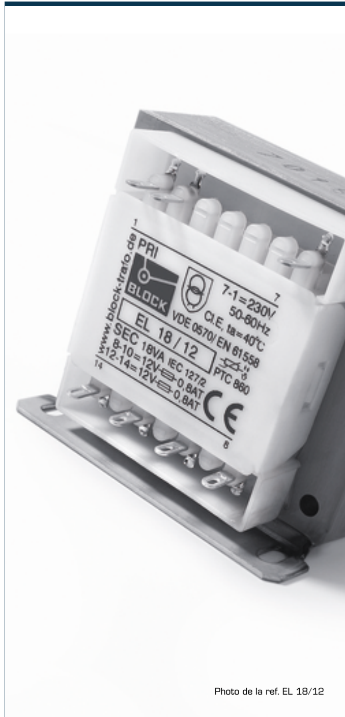
Photo de la ref. EL 18/12