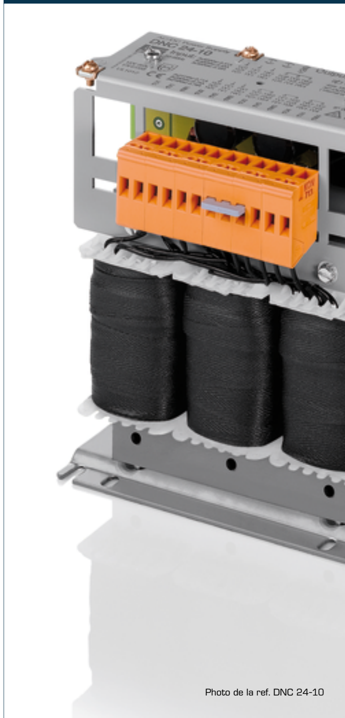
Photo de la ref. DNC 24-10