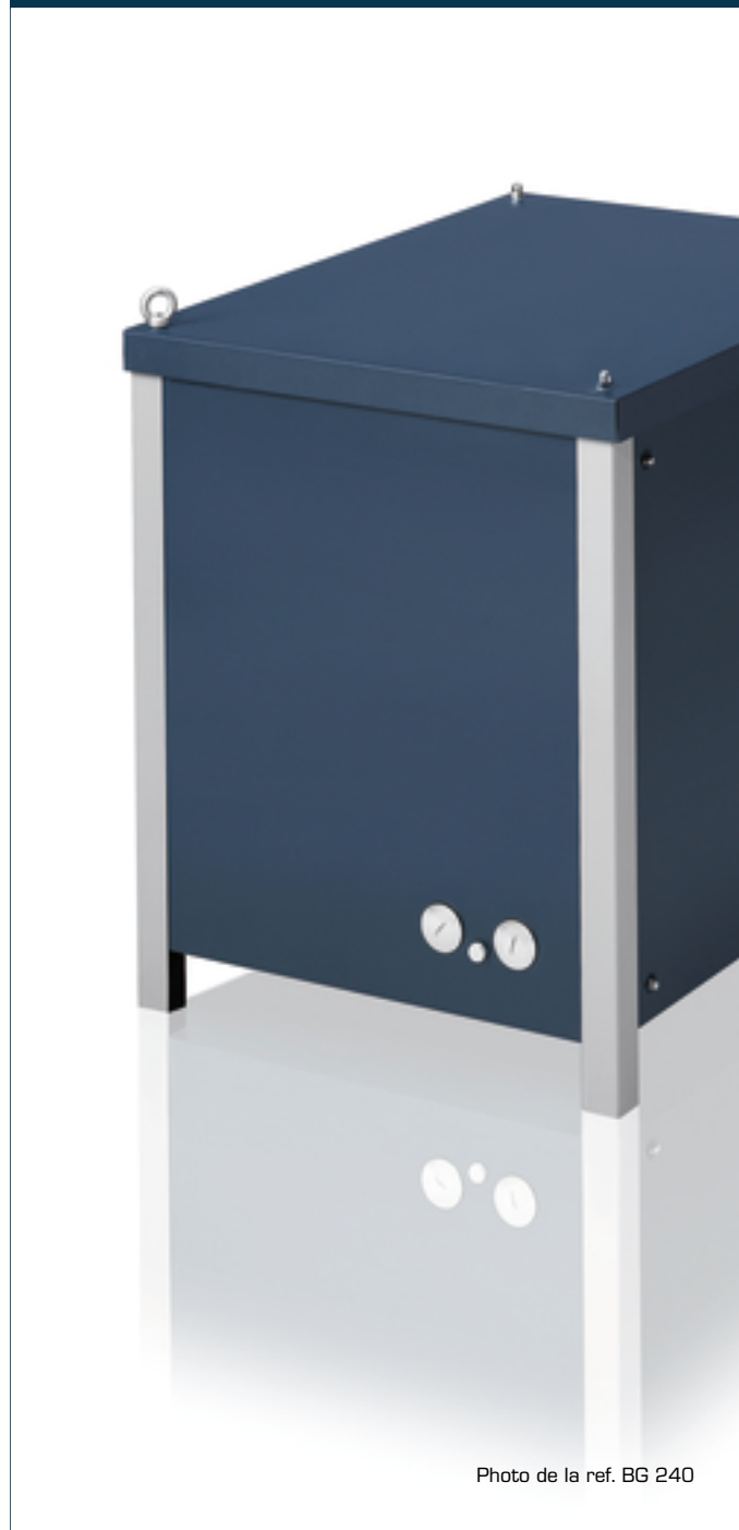
Photo de la ref. BG 240