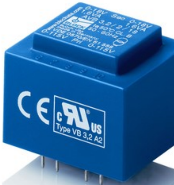
Photo de la ref AVB 3,2/2/18