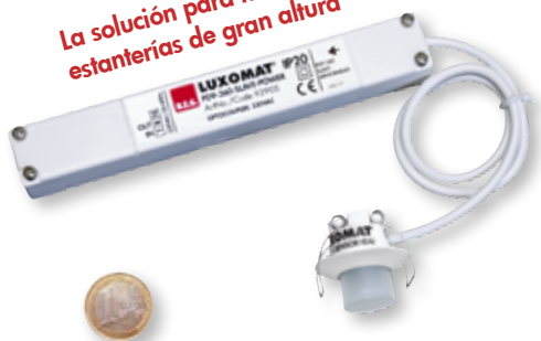
"Referencia de tamaño"

La solución para naves con estanterías de gran altura