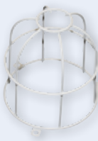
Rejilla de protección metálica