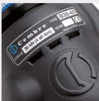
Rendijas de ventilación motor

Accionable en todas las fases de empleo con una sola mano, gracias al equilibrado de las masas, resulta extremadamente versátil y manejable. La cabeza puede girar 180° para facilitar el funcionamiento en los espacios limitados. Provisto de válvula de máxima presión y visualización automática del estado de carga de la batería, permite controlar la correcta ejecución de las compresiones y conocer en cada momento la autonomía restante. La silenciosidad y la ausencia de vibraciones hacen su empleo extremadamente confortable. El cuerpo en material plástico asegura adecuada protección en todas las condiciones de empleo. Batería Ni-MH; más potente, mejor compatibilidad ambiental. Provisto en un robusto maletín en material plástico para contener y proteger la herramienta y todos sus accesorios. Dos baterías y cargadores de baterías incluidos. Amplia gama de matrices intercambiables, disponibles bajo demanda, comunes a las herramientas Cembre de 45 kN. El campo de aplicación es aquel definido en la tabla superior. Para ulteriores detalles consultar las tablas de las páginas 192÷201.