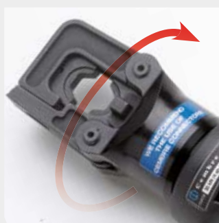
Cabeza rotante de 180°