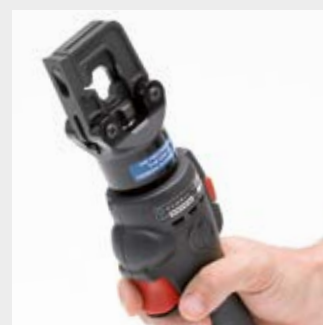
Perfil anatómico para mejorar el confort de la empuñadura

Estas herramientas se suministran sin matrices. Para seleccionarlas, dirigirse al catálogo en las páginas 192÷201