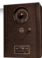
Temporizzatore per macchine a raggi X

Sono passati 80 anni da quando abbiamo creato il nostro primo prodotto, un temporizzatore per macchine a raggi X. I nostri temporizzatori offrono più valore al cliente e al tempo stesso portano i quadri di controllo a un nuovo livello.